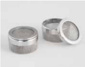
Elmasolvex con RM de la gama de accesorios

¿Se puede mejorar la tecnología probada?