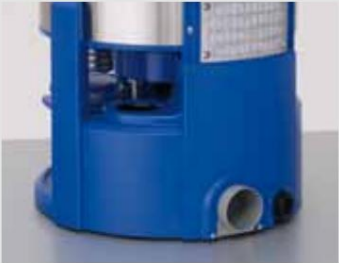
Conexión al enrutamiento del revisado aire de escape