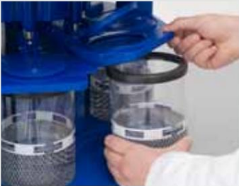
Llenado e inserción de contenedores de medios