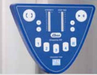
Programa de inicio