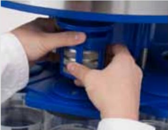
Cesta de inserción con piezasde reloj